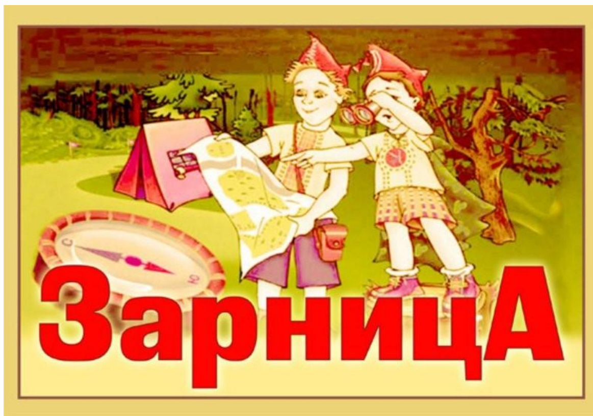
Иллюстрация к военное – спортивному развлечению «Зарница -Школа молодого бойца»!

Список реквизита и дидактический материал: Мягкие модули (разной формы), мешочки размером 7*10 см массой 200 гр, обручи, канат, дуги, 12 пластиковых бутылочек, наполненными водой, веревка с прикрепленными колокольчиками, бинты, конусы, флажки, воздушные шары, пазлы, муляж штаба, грамоты, медали, судейский штаб.