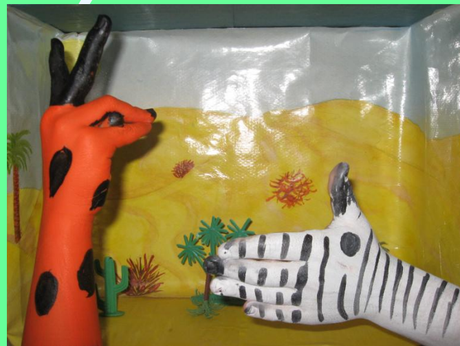
Зебра – лошадь небольшая Полосатая смешная