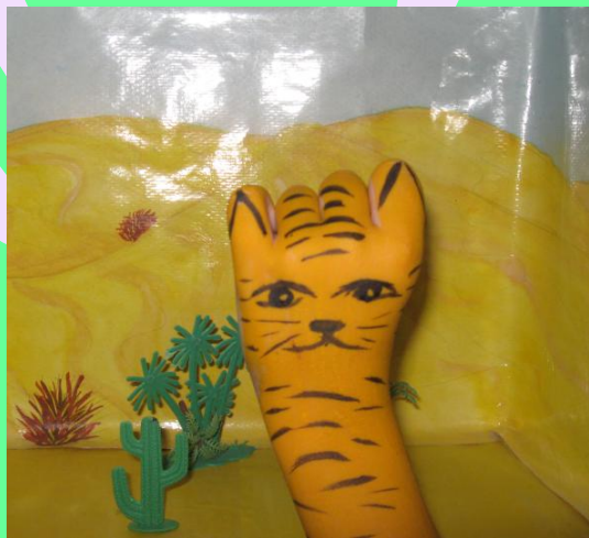
Тигр – клыкастый, полосатый Длиннохвостый и усатый.