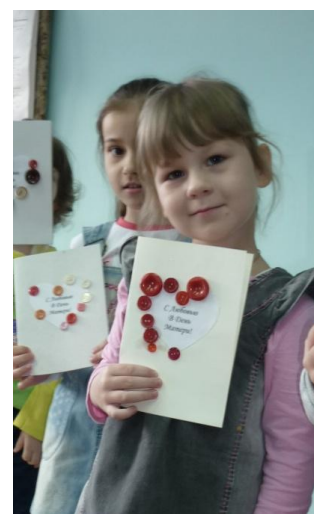
Творческая открытка учащихся Группы раннего эстетического развития