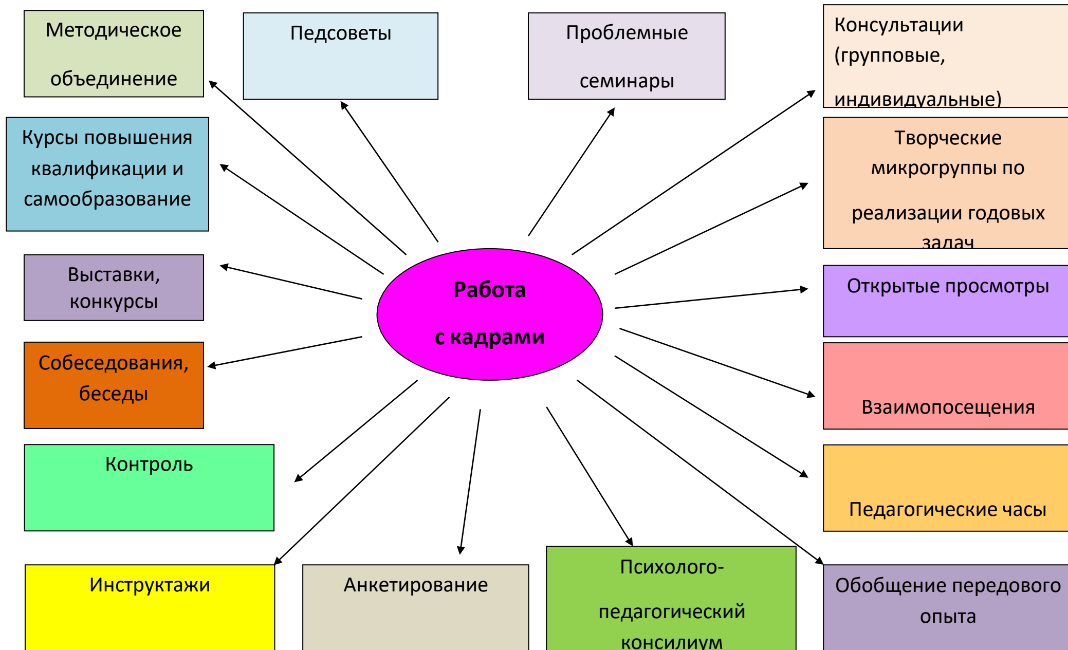
Схема организации работы с кадрами