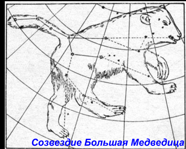
Созвездие Большая Медведица

Как называют группы звезд, которые складываются в четко различимые рисунки?