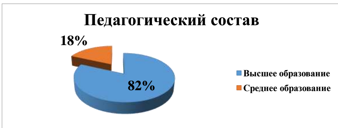
Диаграмма с характеристиками кадрового состава детского сада

Участие педагогов в научно-практических конференциях, семинарах, мастер-классах и др. разного уровня: