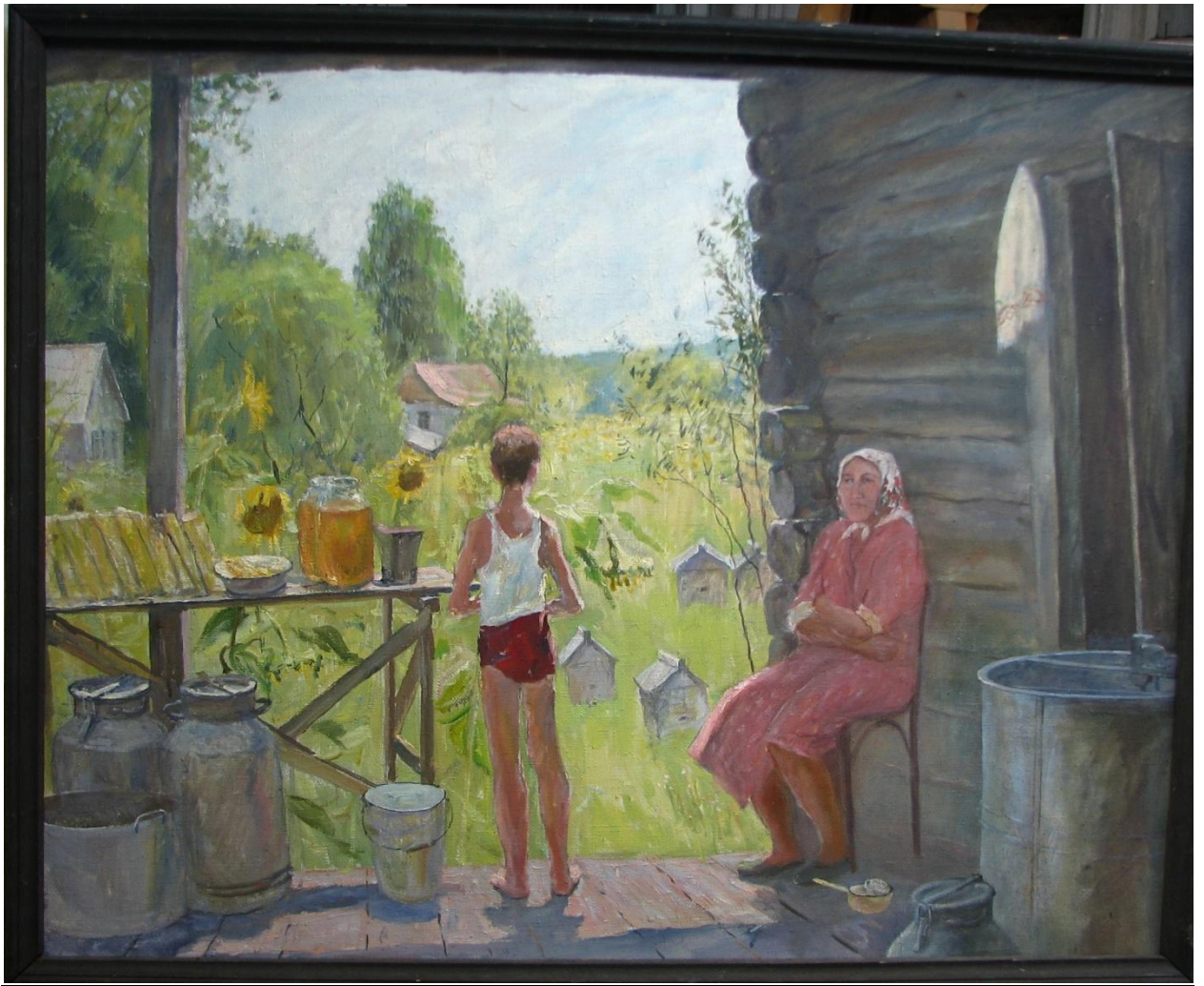
«Медовая пора» х.м.