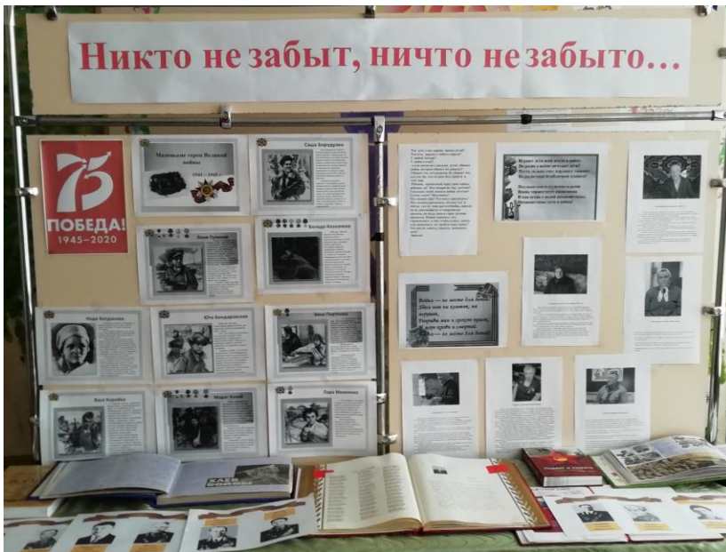
Стенд в школьном коридоре.