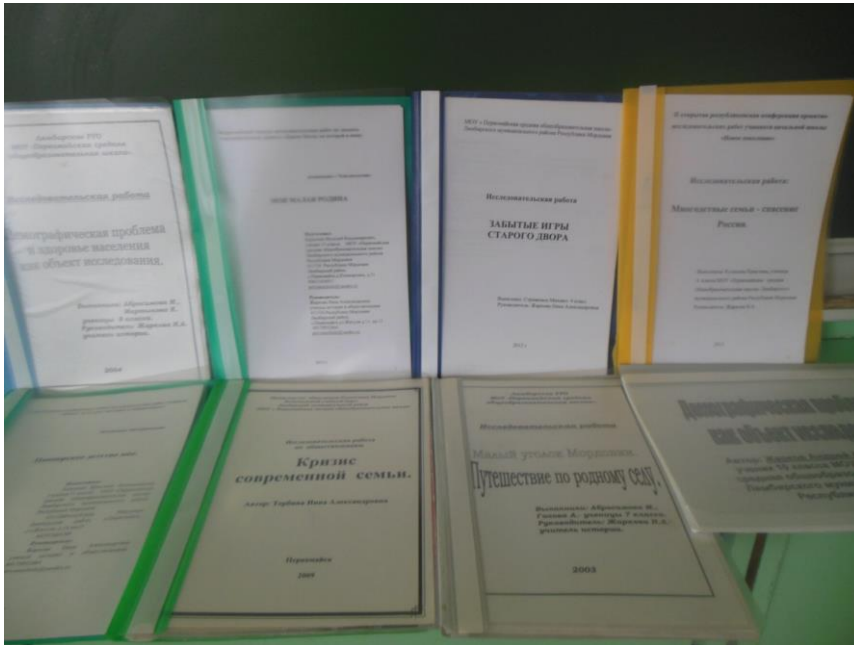
Исследовательские работы по истории села (прошлое и настоящее)