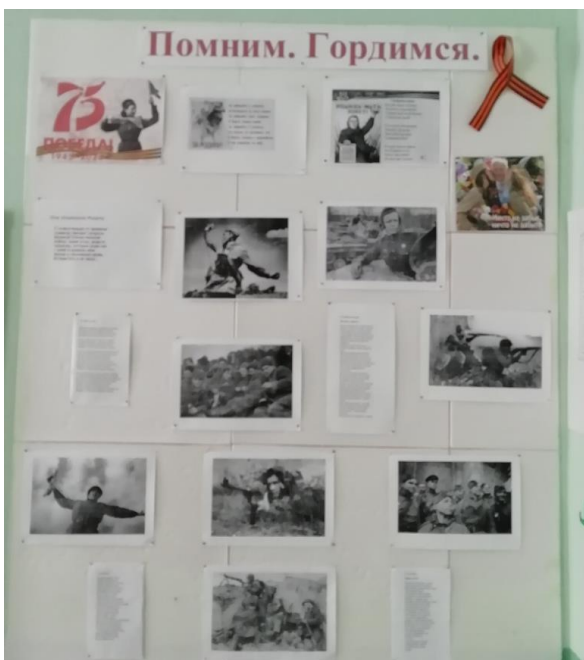
Стенд в кабинете истории