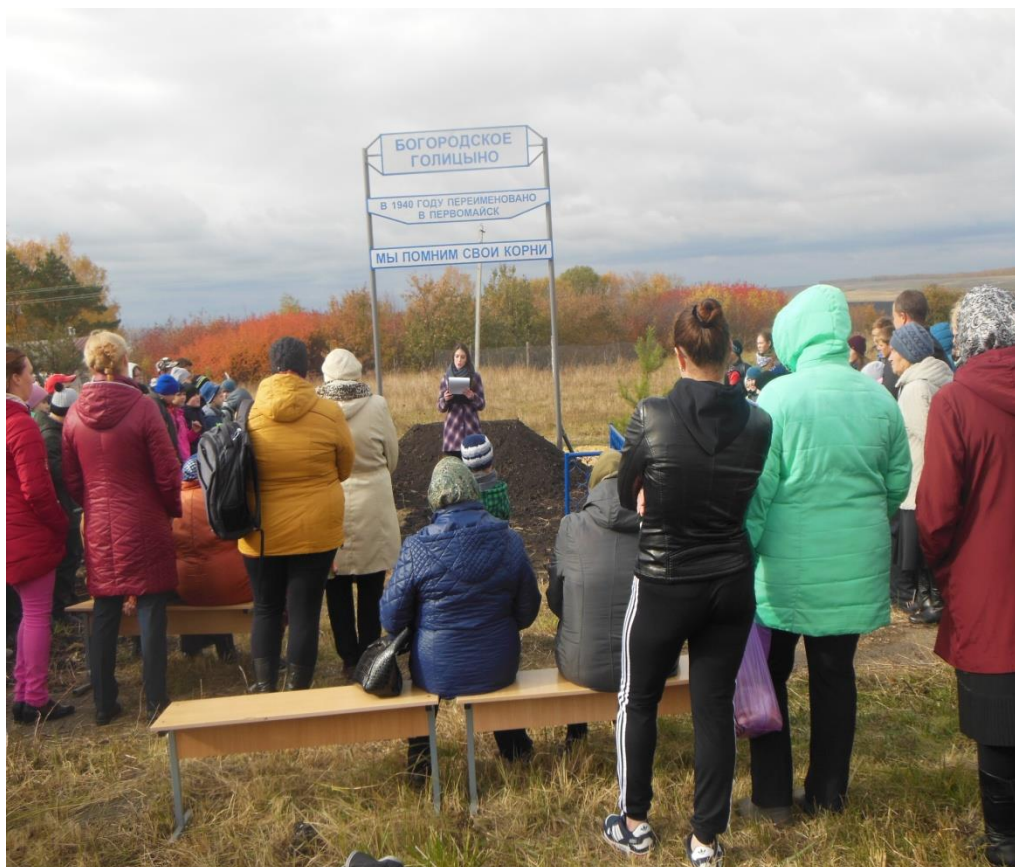
Учащиеся школы, жители села на открытии памятного знака « Богородское Голицыно. Мы помним свои корни» в октябре 2018 г