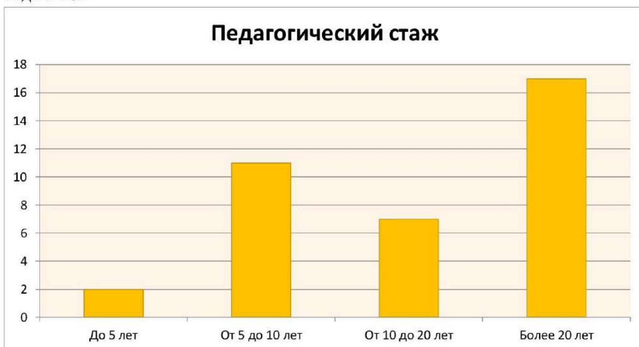
Диаграмма с характеристиками кадрового состава МАДОУ «Детский сад № 18»

квалификации. Все это в комплексе дает хороший результат в организации педагогической деятельности и улучшении качества образования и воспитания дошкольников. По итогам 2021 года МАДОУ перешел на применение профессиональных стандартов. Из 31 педагогического сотрудника детского сада все соответствуют квалификационным требованиям профстандарта «Педагог». Их должностные инструкции соответствуют трудовым функциям, установленным профстандартом «Педагог».