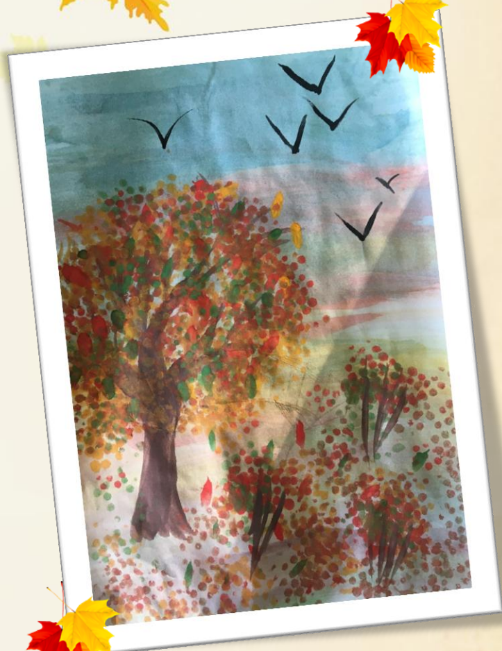
Вика Б., 6 лет, группа №4