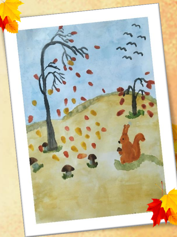
Лиза У., 6 лет группа №4