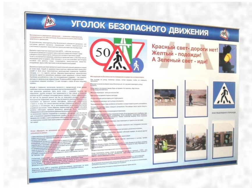
Уголок расположен в фойе детского сада.

Информационные и пропагандистские материалы по безопасности дорожного движения должны быть во всех детских садах. Они оформляются в виде специальных стендов или щитов (один или несколько) и, как правило, располагаются на видном месте в вестибюле ДС, желательно на выходе из детского образовательного учреждения.