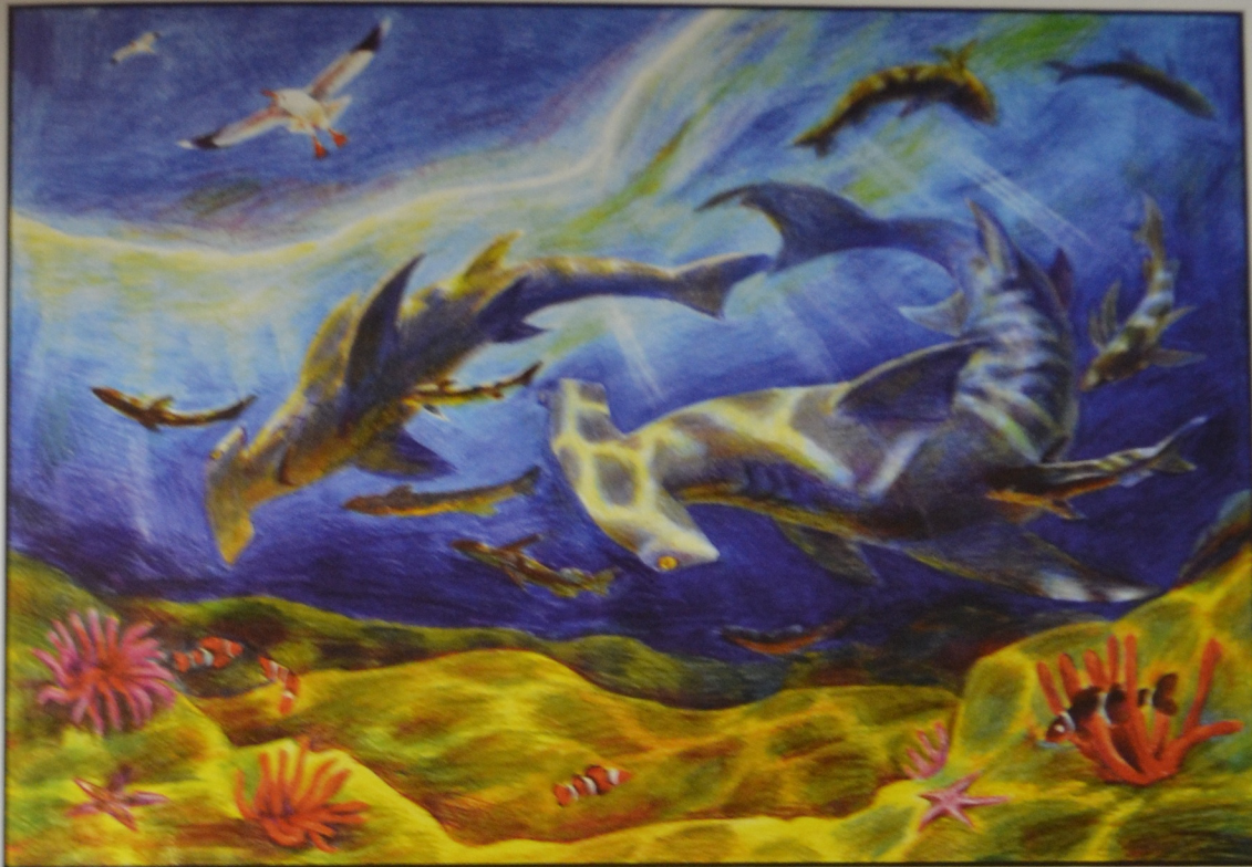
4. Ксения Кузьмина, 16 лет. «Подводный мир»