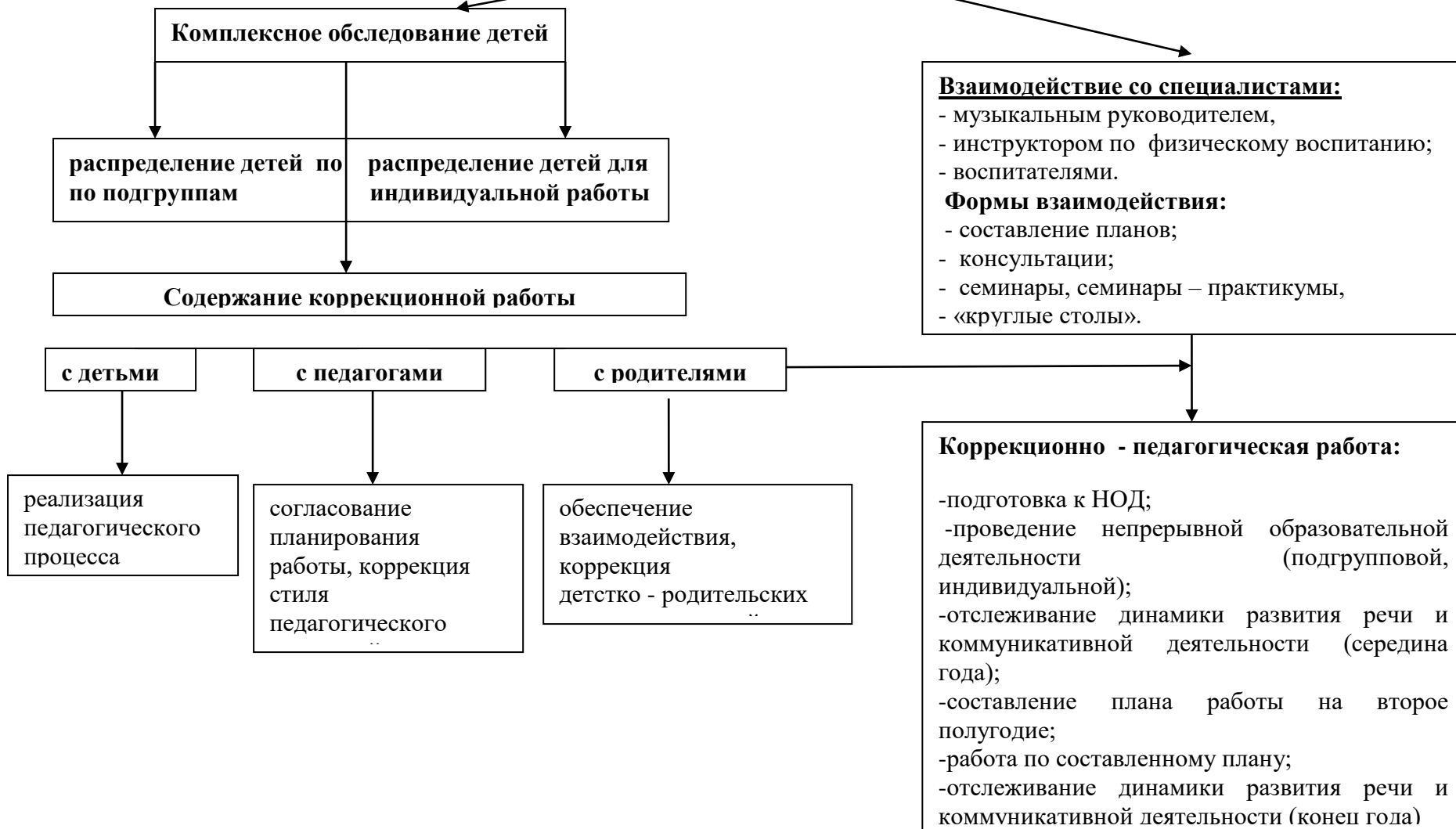
Схема организации коррекционной работы учителя - логопеда