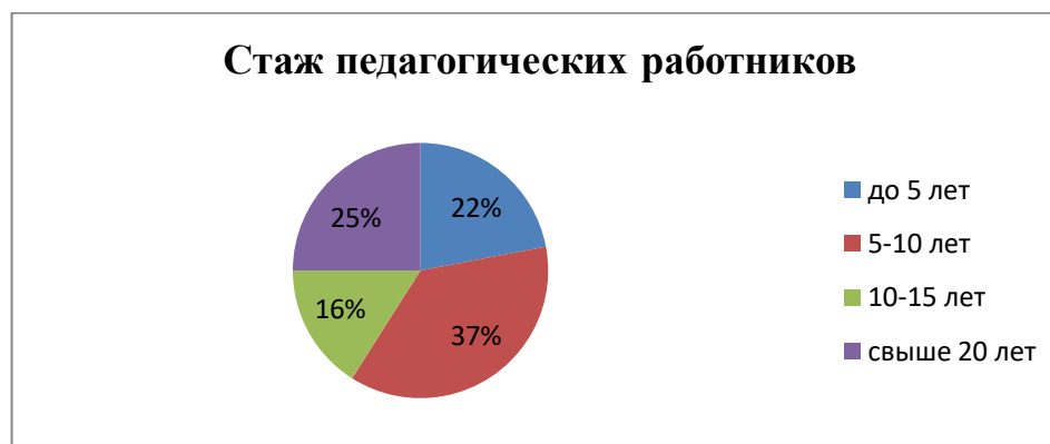
Диаграмма с характеристиками кадрового состава.

Курсы повышения квалификации в 2021 году прошли 29 педагогов детского сада. По итогам 2021 года ДО перешла на применение профессиональных стандартов. Из 32 педагогических сотрудников детского сада все соответствуют квалификационным требованиям профстандарта «Педагог». Их должностные инструкции соответствуют трудовым функциям, установленным профстандартом «Педагог».