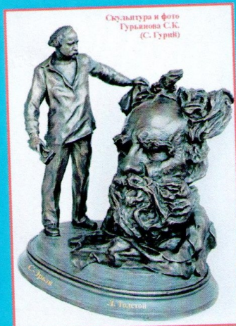
Скульптура и фото Гурьянова С.К. (С. Гурьев)