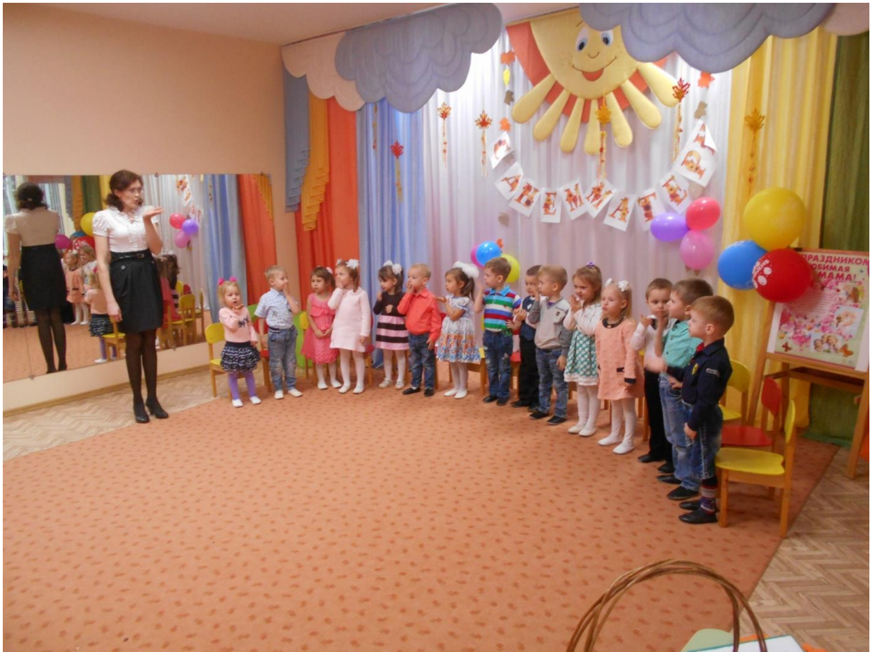
Дети поздравляли своих мам, рассказывали стихотворения.