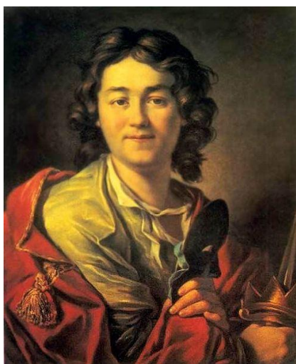
Портрет актёра Ф.Г. Волкова А. Лосенко