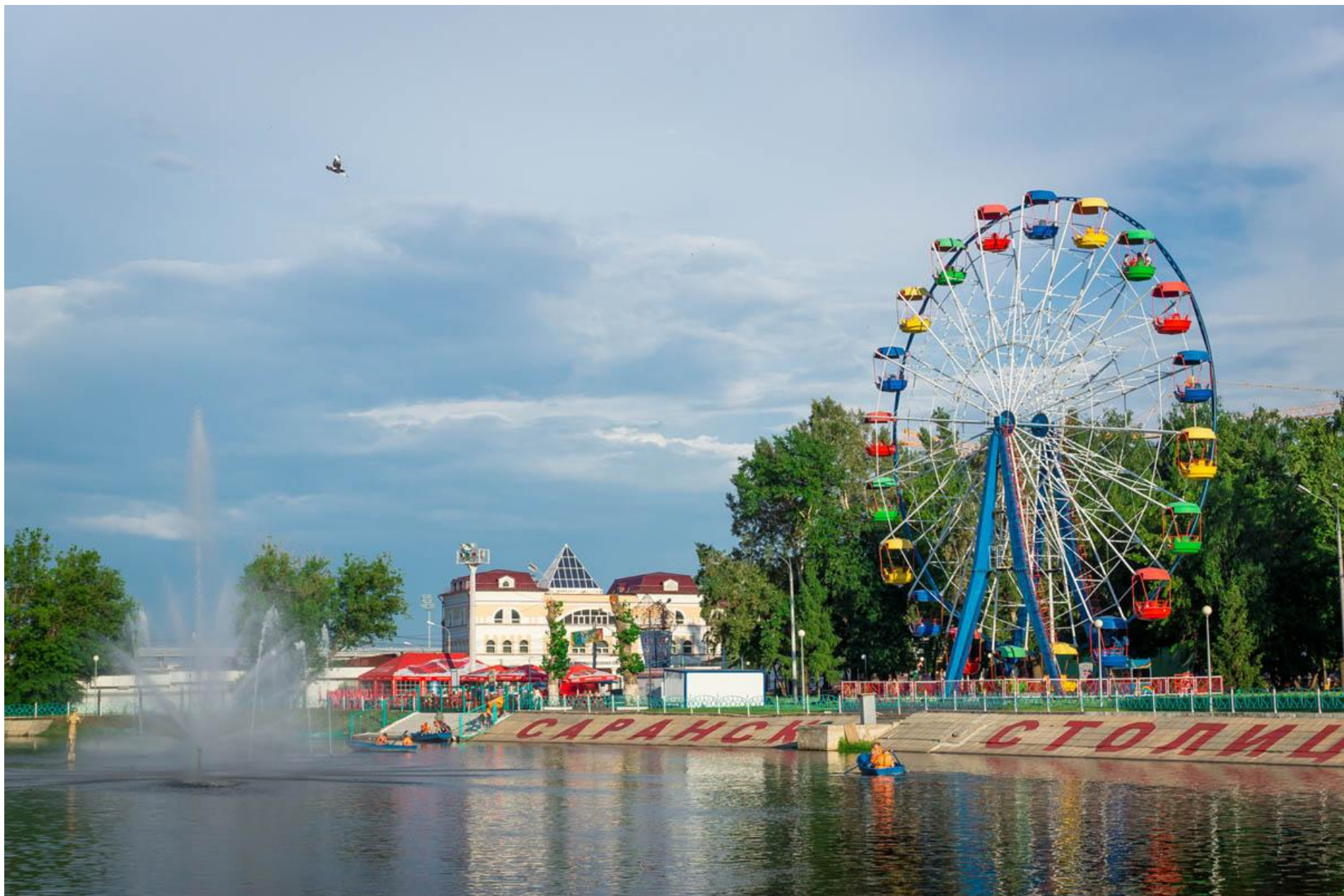
Парк культуры и отдыха имени А.С. Пушкина