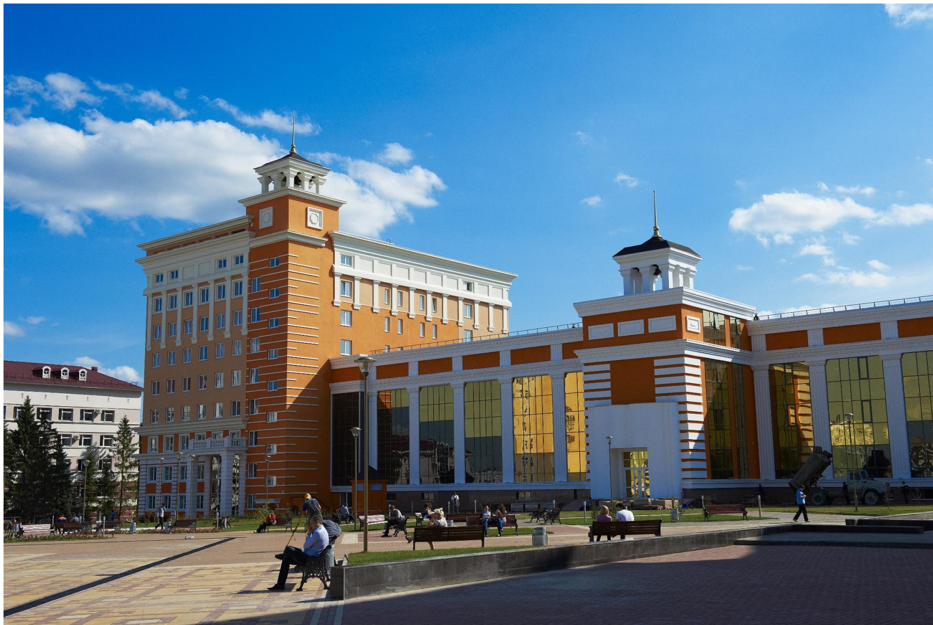
Библиотека имени А.С. Пушкина