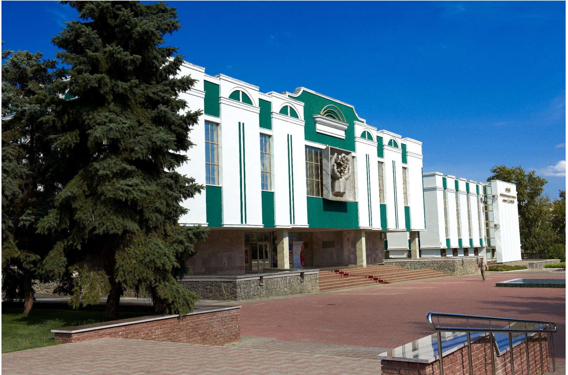
Музей изобразительных искусств имени С.Д. Эрзы