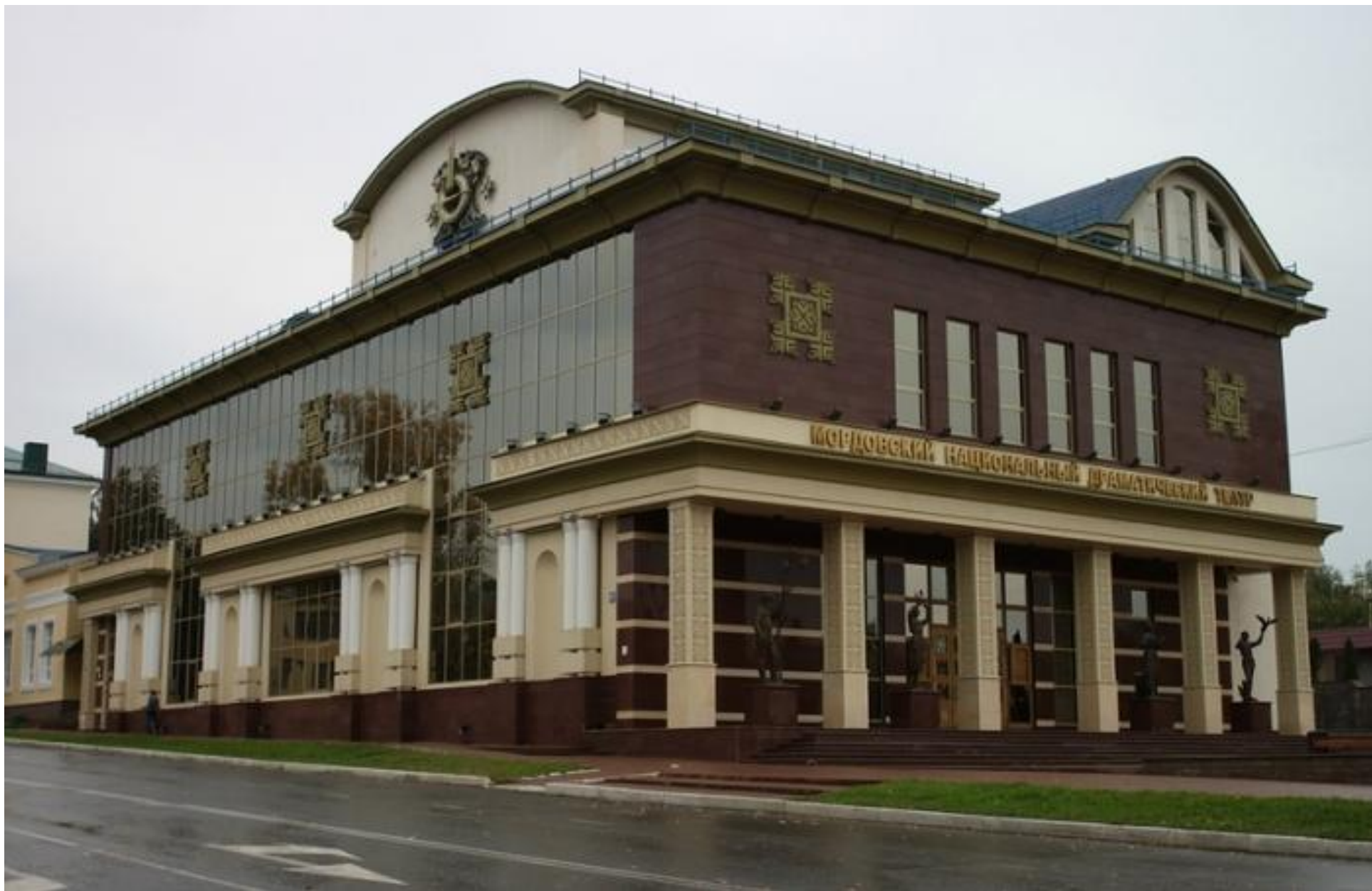
Мордовский национальный драматический театр