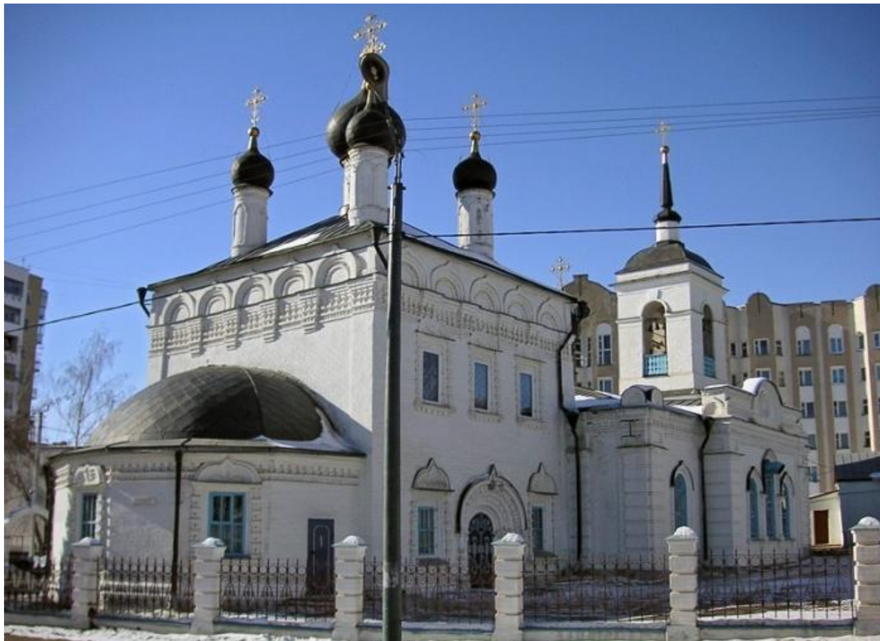
Церковь Иоанна Богослова