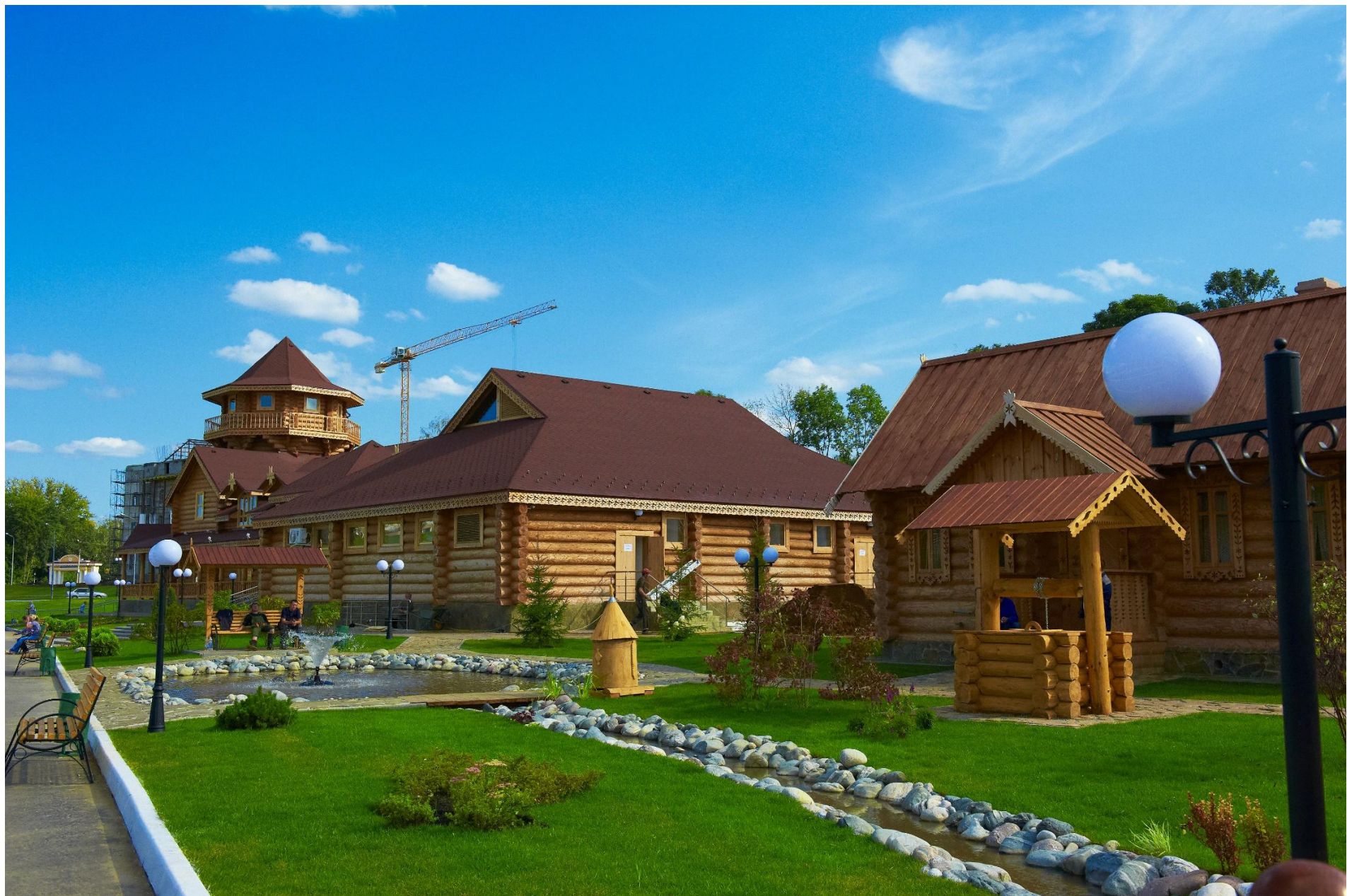
Мордовское подворье на берегу реки Саранки