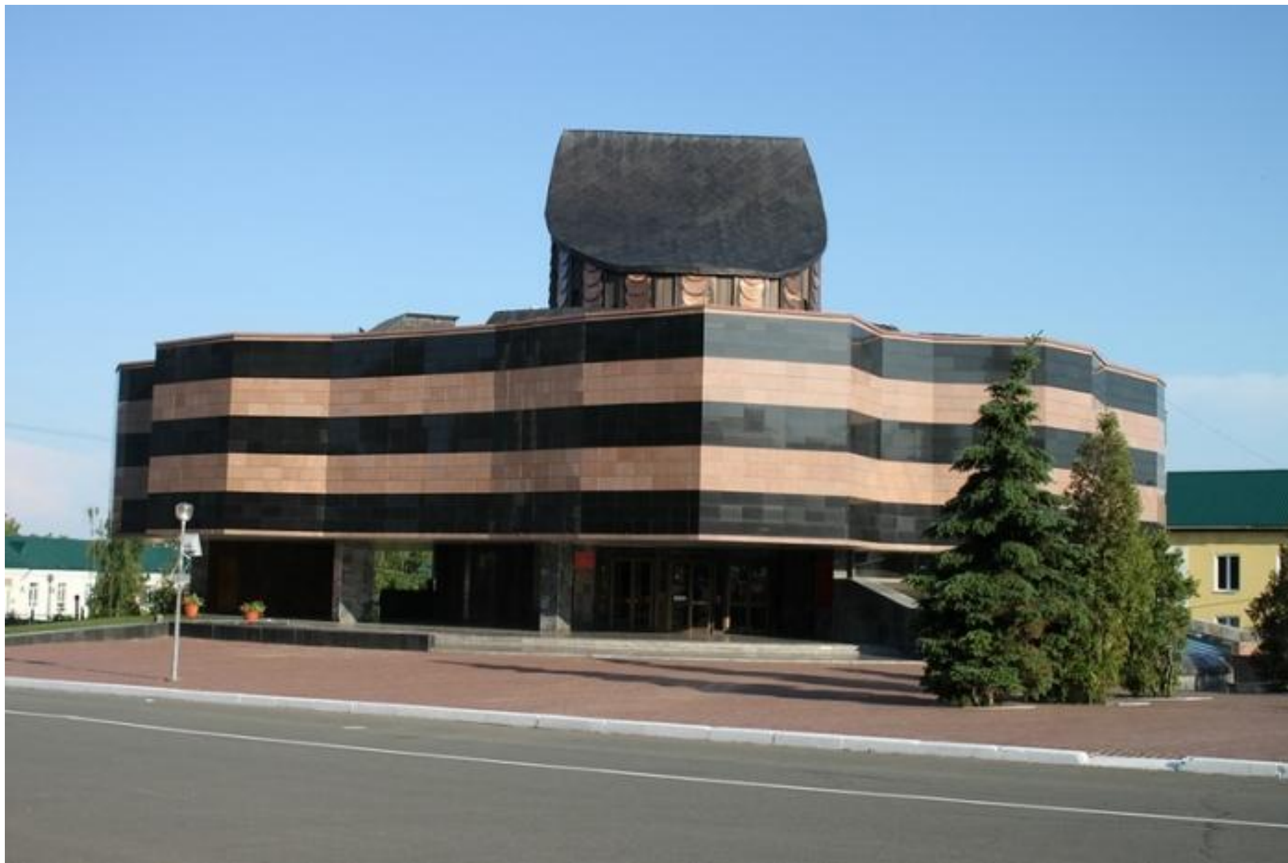
Музей боевого и трудового подвига