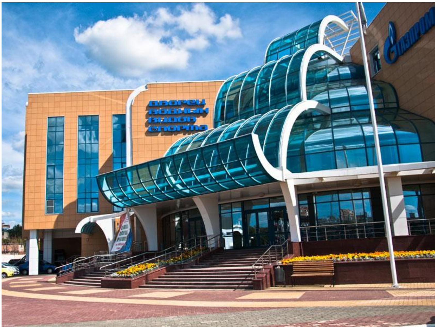
Дворец водных видов спорта