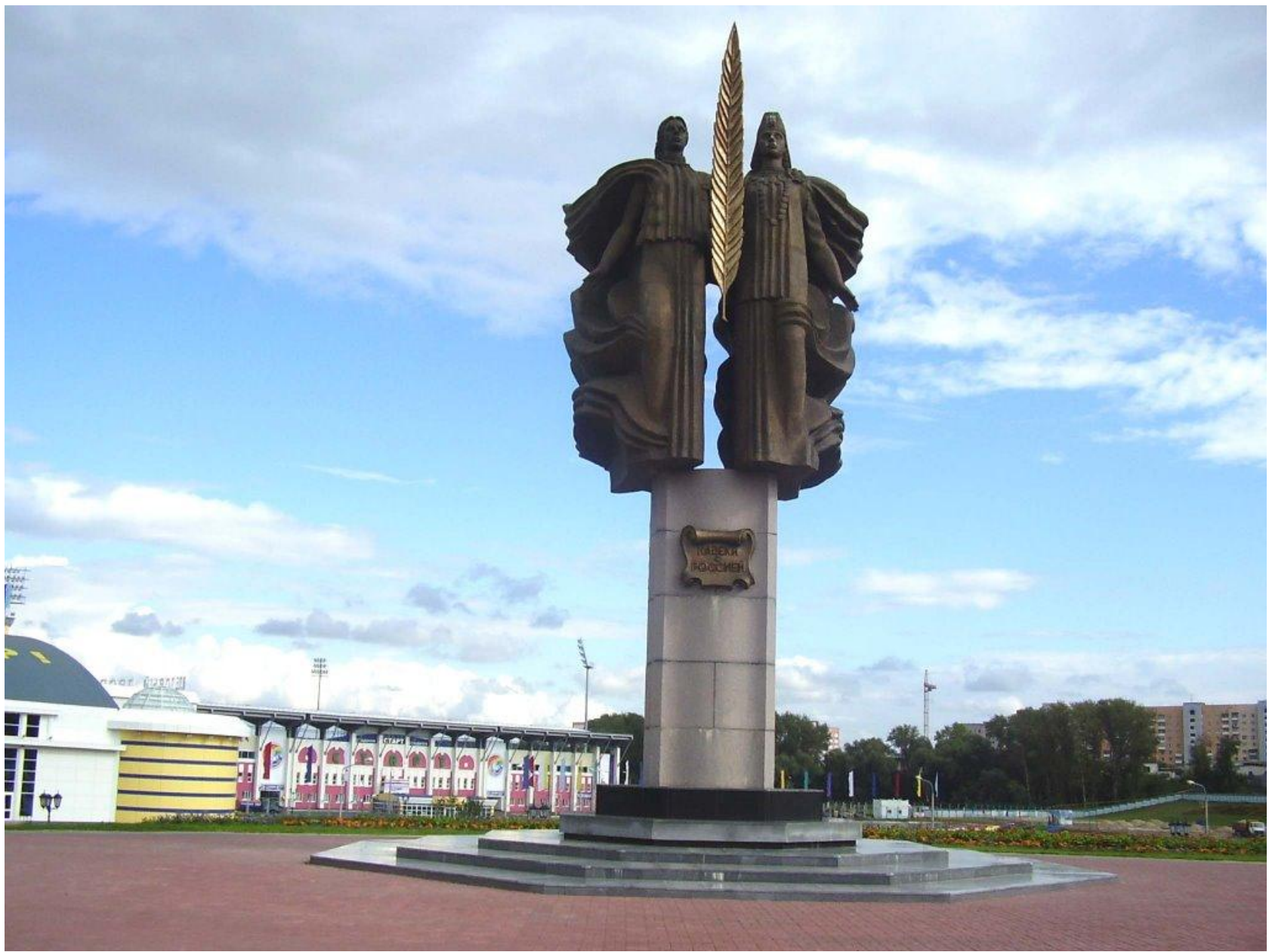
Памятник «Навеки с Россией»