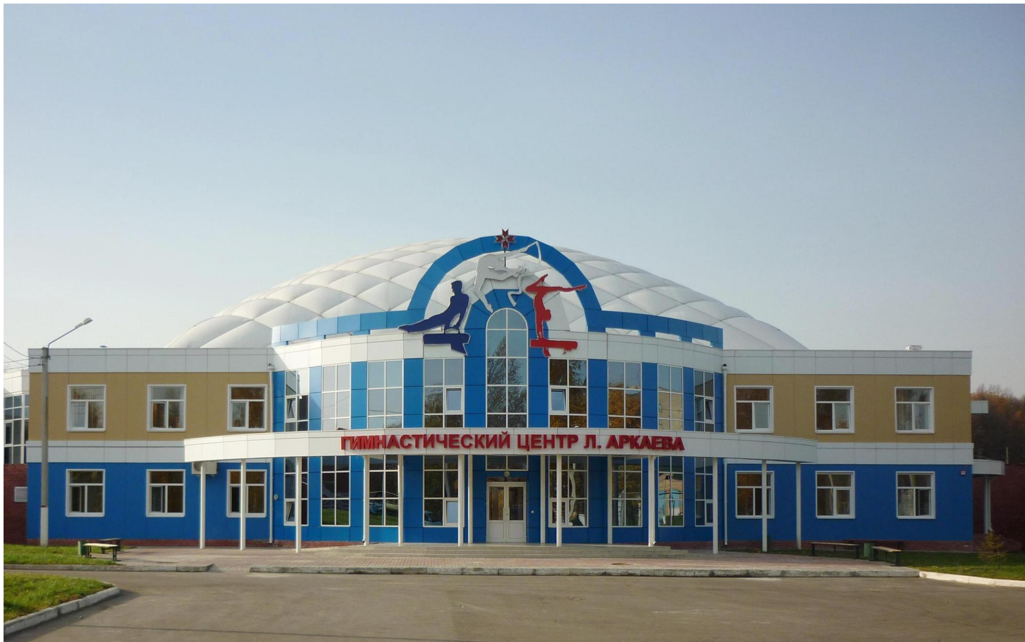
Гимнастический центр Л. Аркаева