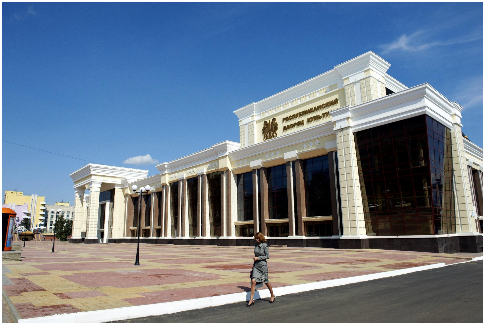
Республиканский дворец культуры