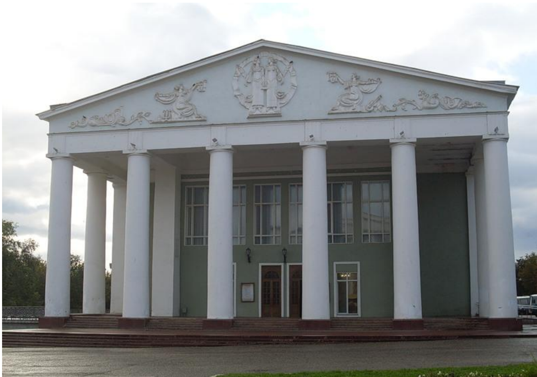
Русский драматический театр