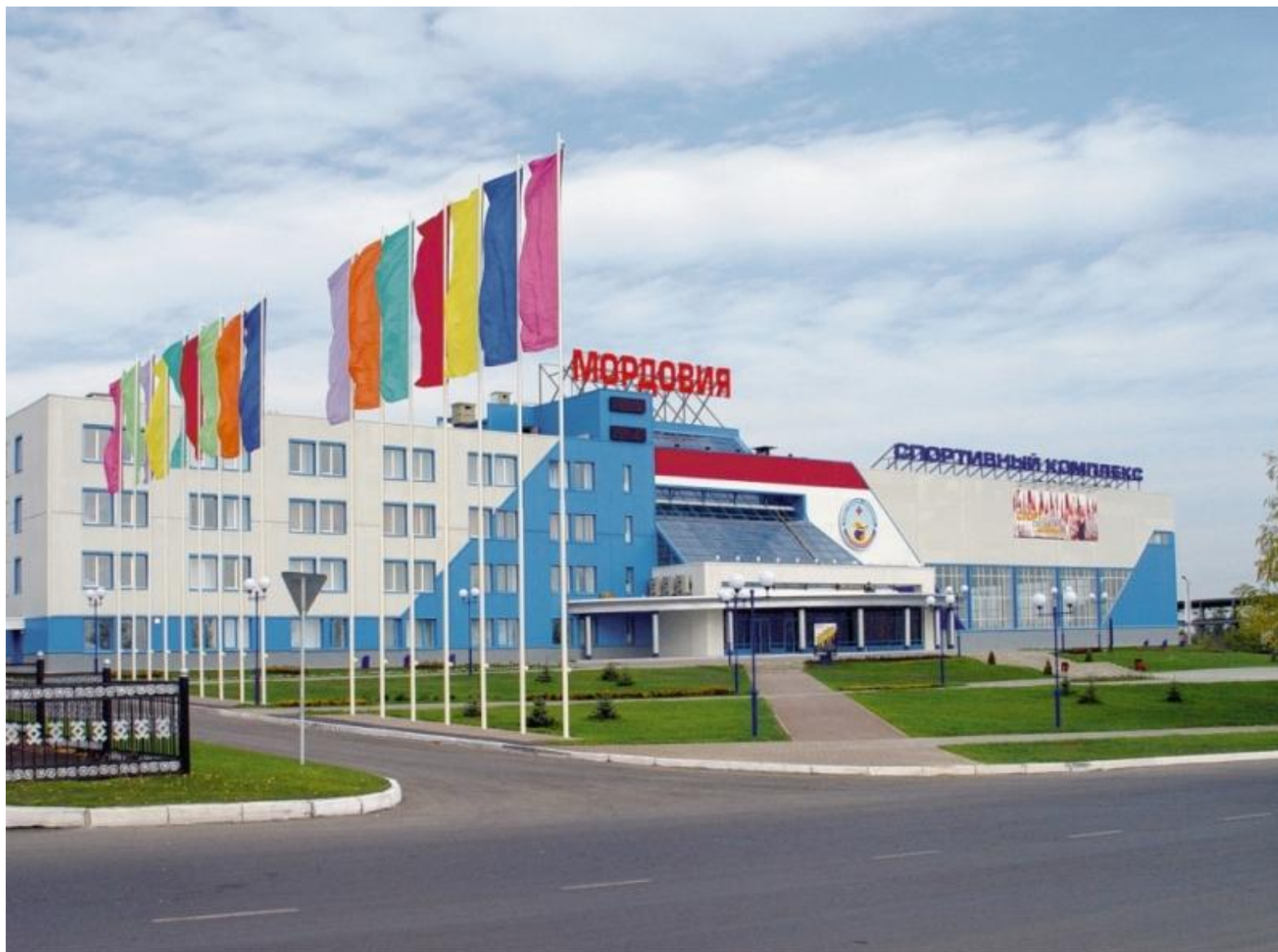
Спортивный комплекс «Мордовия»