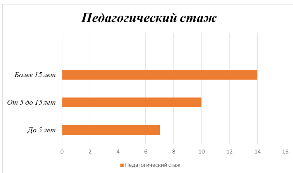
Диаграмма с характеристиками кадрового состава МАДОУ «ЦРР – детский сад № 58»

По итогам 2023 года МАДОУ перешел на применение профессиональных стандартов. Из 31 педагогического сотрудника детского сада все соответствуют квалификационным требованиям профстандарта «Педагог». Их должностные инструкции соответствуют трудовым функциям, установленным профстандартом «Педагог».