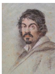
Микеланджело да Караваджо

Составить 5 вопросов по творчеству Караваджо.