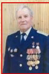
Девятаев Михаил Петрович. Герой Советского Союза.

Родился 8 июля 1917 года в Мордовии, в рабочем поселке Торбеево. Шестьдесят пять лет назад, 8 февраля 1945 года он вместе с девятью узниками нацистской военной базы Пенемюнде совершил побег с острова Узедом. Об этом подробно Михаил Девятаев рассказывал и в своей книге «Побег из ада». Совершив беспрецедентный подвиг, аналогов которого не было во время Великой Отечественной войны, Михаил Петрович Девятаев навсегда вошел в историю страны.