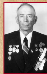
Котов Александр Григорьевич Герой Советского Союза

Земли Мордовской ветераны, Что прошли по дорогам войны. Пусть болят у них старые раны, Но духом они, как и прежде сильны.