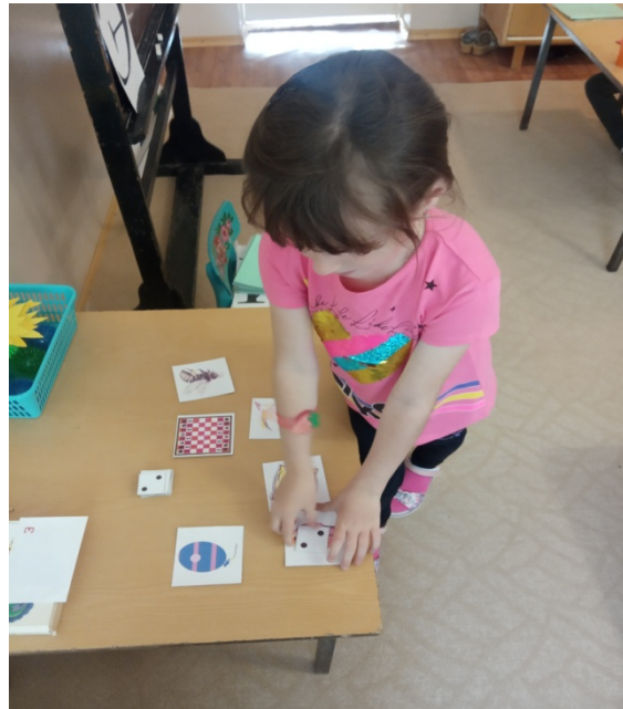
Игра «Магазин» на определение количества слогов