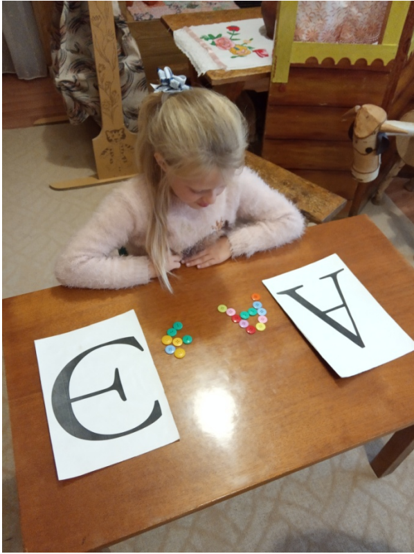
Выкладывание из пуговиц гласных букв,