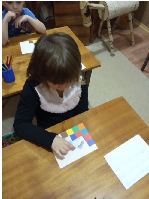
Работа над слоговой структурой в игре «Пирамидка»