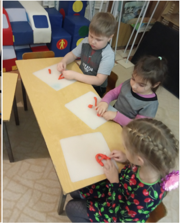
Досуг : »В гостях у гласных»