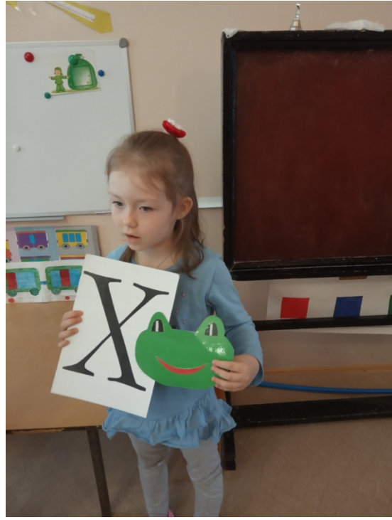
Звуковой домик и «Лягушки –подружки»