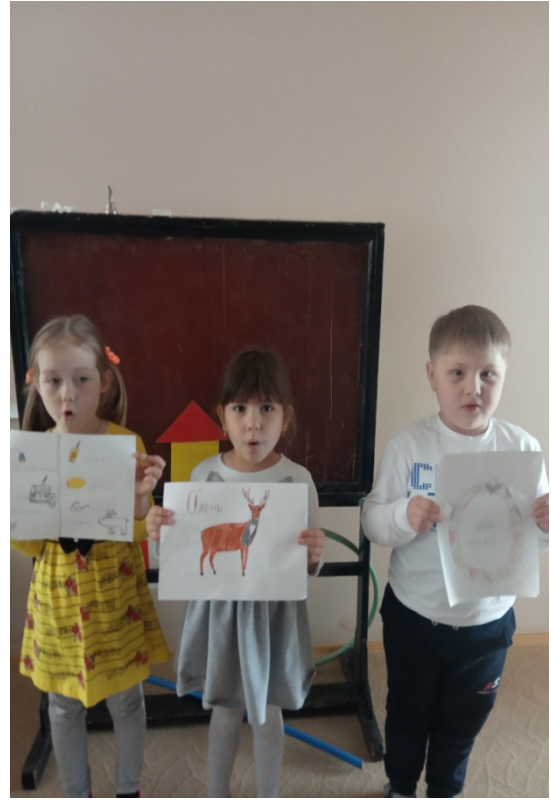
конкурс рисунков «Вот такая буква О»