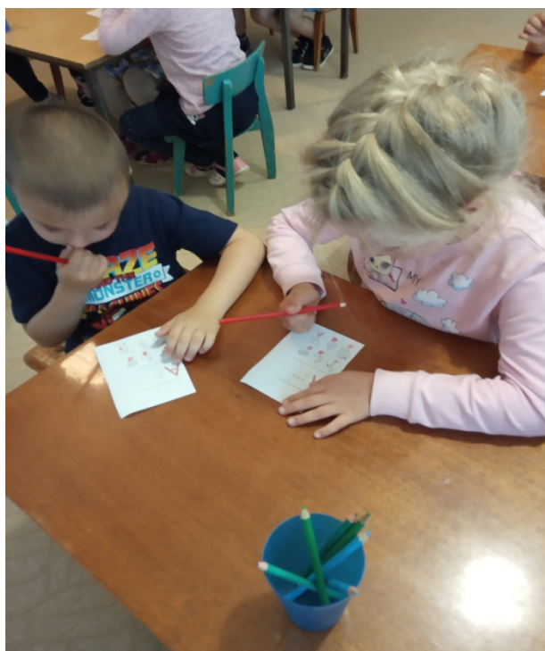
фрагменты занятий при изучении гласных звуков