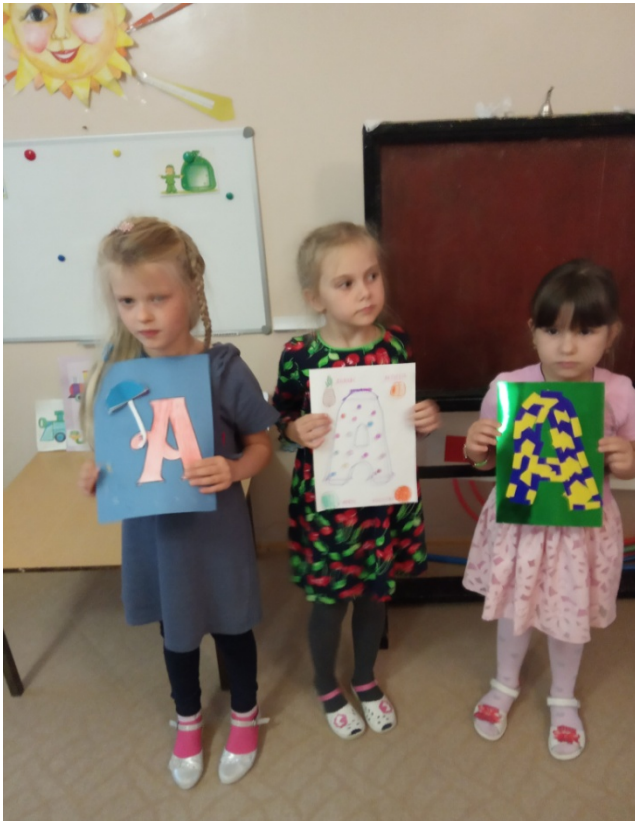
Вот такие замечательные буквы изготовили дети совместно с родителями