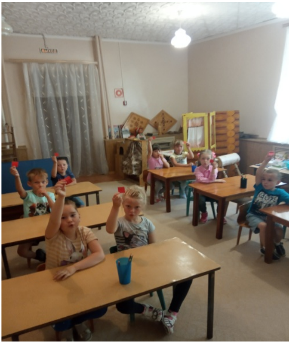
игра «Фишку подними , звук определи»