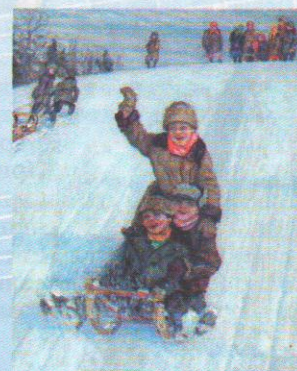
На 1-й странице обложки Н. Богданов-Бельский. Катание с горы