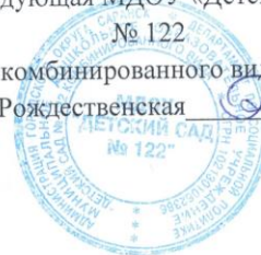
График работы учителя-дефектолога