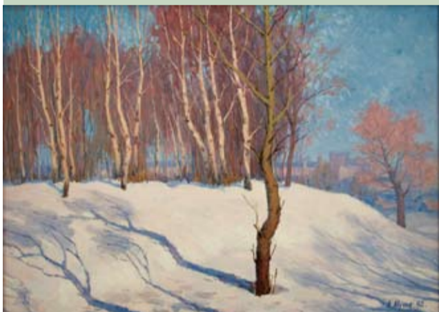
Мартовские тени. 1992. (Дар музею)