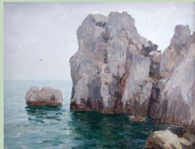
Туман над морем. 1981