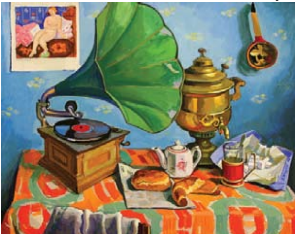
Натюрморт с граммофоном. 1969