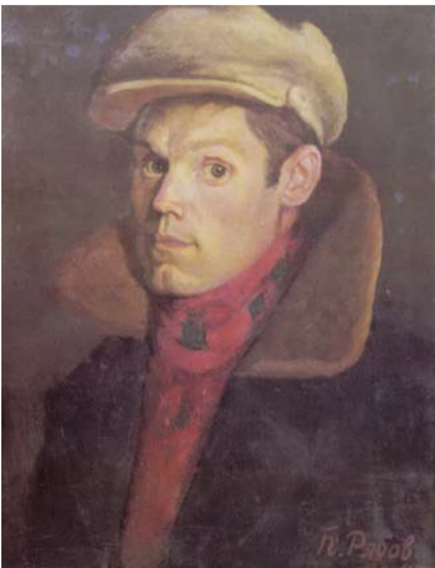
Автопортрет в кепке. 1947

Желание молодого художника творить было прервано службой в Советской армии. Но и во время службы он не выпускал