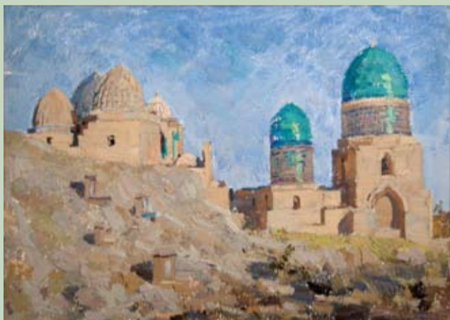
Самарканд. Мавзолей Шахи-Зинда. 1971