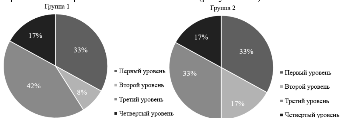
Рисунок 2.1 Уровень сформированности проективных компетенций обучающихся 9 «А» класса

Обе группы в целом продемонстрировали средний уровень сформированности проективных компетенций (рисунок 2.1).