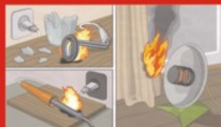
Оставленные без присмотра электронагревательные приборы