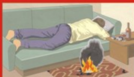
Курение в постели