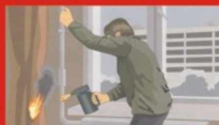
Отогревание замерзших труб паяльными лампами и факелами