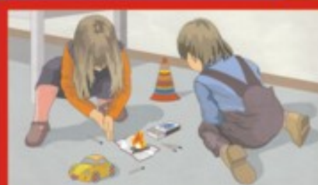
Шалость детей с огнем

Огнетушитель порошковый ОП-2 Предназначен для тушения всех видов пожаров.