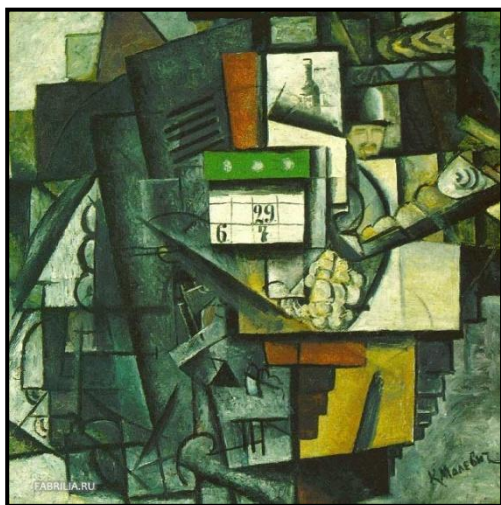
Каземир Малевич. Дама на остановке трамвая. 1913 г.