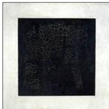
Каземир Малевич. Черный супрематический квадрат. 1914-1915 г.г.