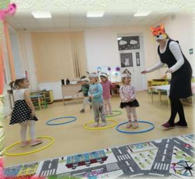
Проект « Птицы наши друзья»

Моя тема самообразования «Проектная деятельность как средство развития познавательной активности дошкольников» . Метод проектов заинтересовал меня потому, что его основная идея состоит в стимулировании интереса дошкольников к экспериментальной деятельности. Главное достоинство проектного метода – высокая степень самостоятельности, инициативности дошкольников. Главное для меня – увлечь детей, показать им значимость их деятельности и вселить уверенность в своих силах, а также привлечь родителей к участию в делах своего ребенка. Я считаю, что проектная деятельность дошкольников – это, прежде всего творческая деятельность, направленная на постижение окружающего мира, открытие детьми новых для них знаний и способов деятельности.