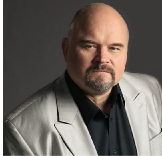
Михаил Гужов Заслуженный артист России, «Геликон-Опера»