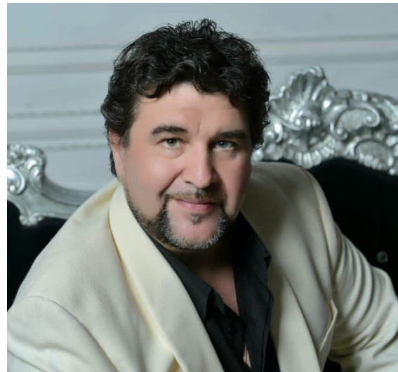
Роман Муравицкий Солист Большого театра, заслуженный артист России