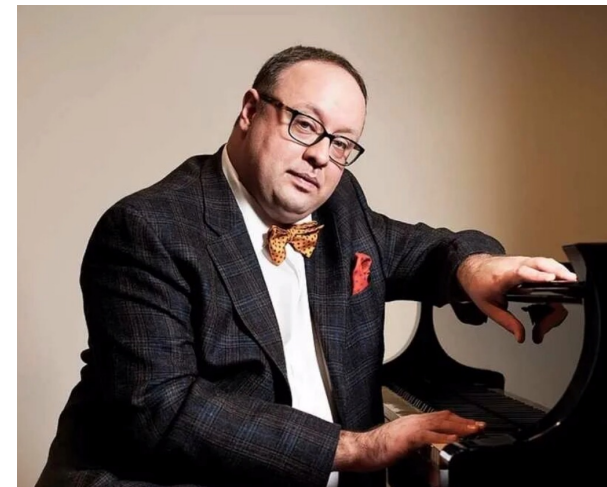
Александр Гиндин Российский пианист, Заслуженный артист РФ