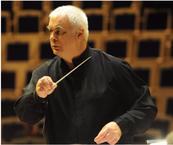
Полянский Валерий Дирижёр, общественный деятель, профессор МГК, Народный артист РФ, лауреат Государственной премии РФ.