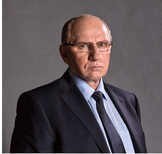
Валерий Баринов Советский и российский актёр театра и кино; народный артист РФ